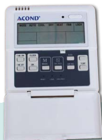
Kabelový ovladač KJR-10B