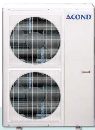
Venkovní jednotka AO-60 HN